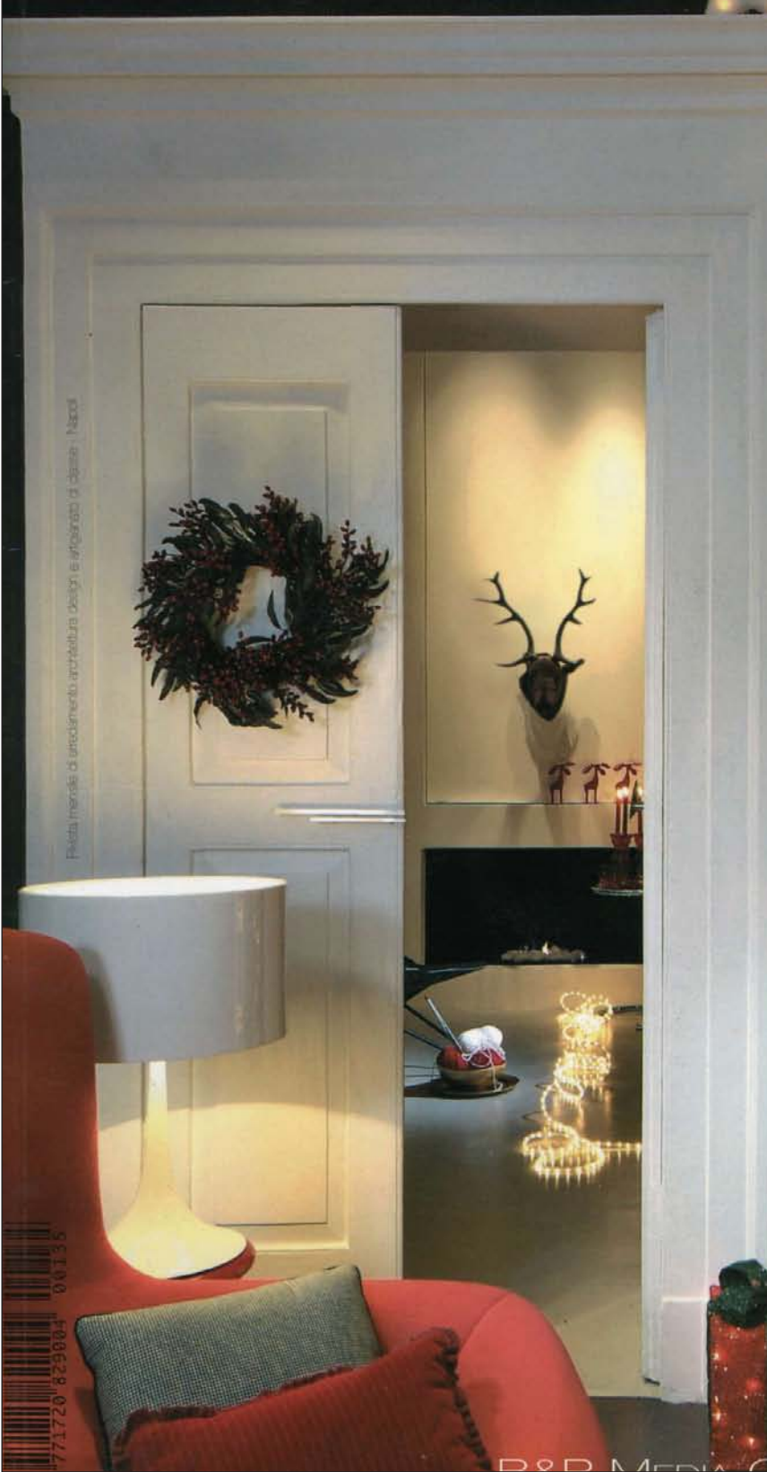
Foto: Miroslav di un'immagine architettonica design e arredamento di classe - Napoli